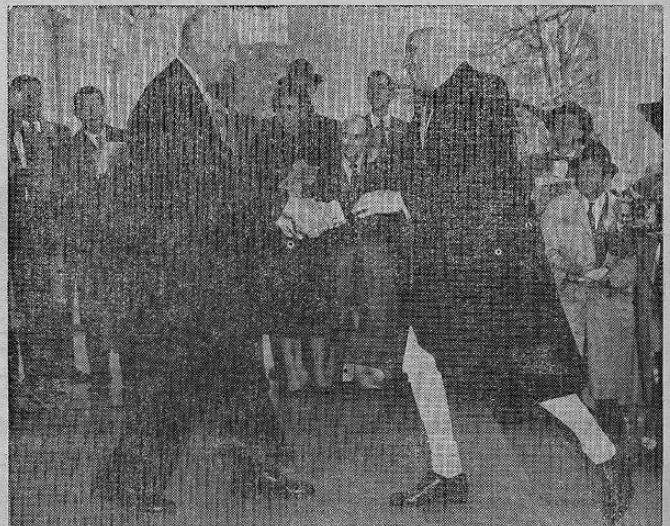
Washington, D. C. — El Presidente Eisenhower da la bienvenida al Primer Ministro Nehru en la Casa Blanca con motivo de la llegada del líder indú a los Estados Unidos para una visita de seis días. Los dos conferenciaron en la casa de la finca del Presidente cerca de Gettysburg, Pensylvania, después de la cual Mr. Nehru visitó las Naciones Unidas en New York.